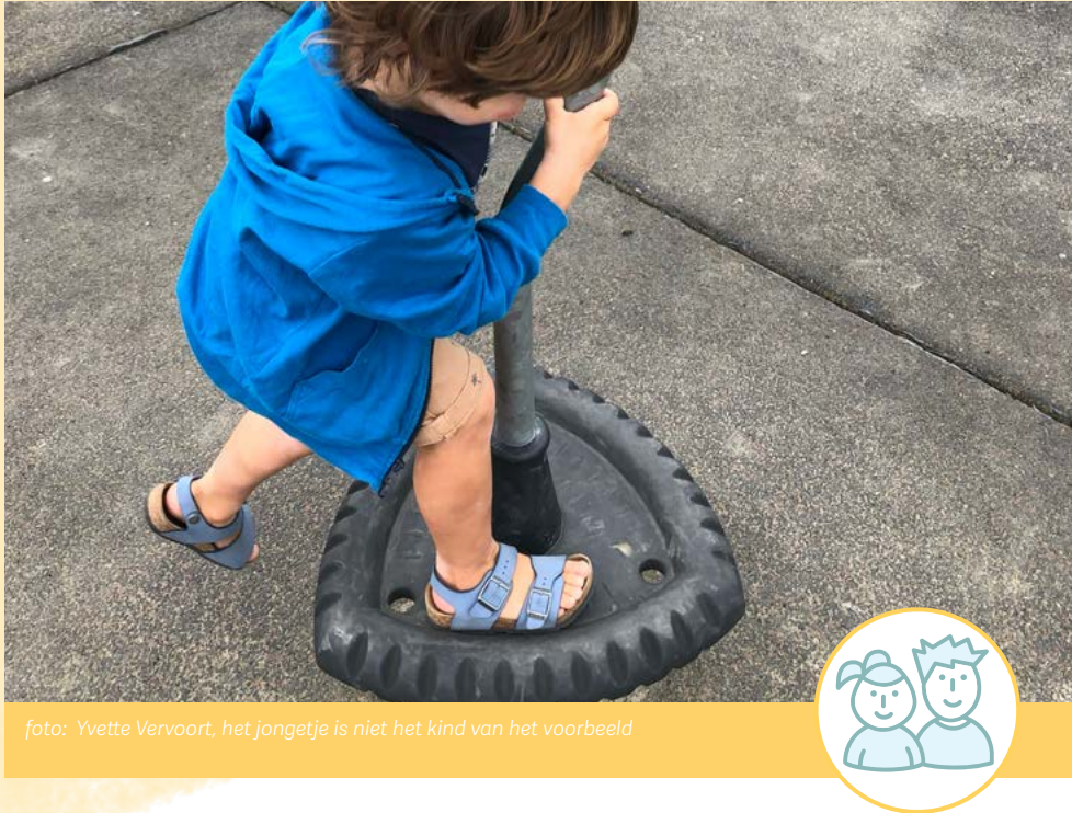
foto: Yvette Vervoort, het jongetje is niet het kind van het voorbeeld