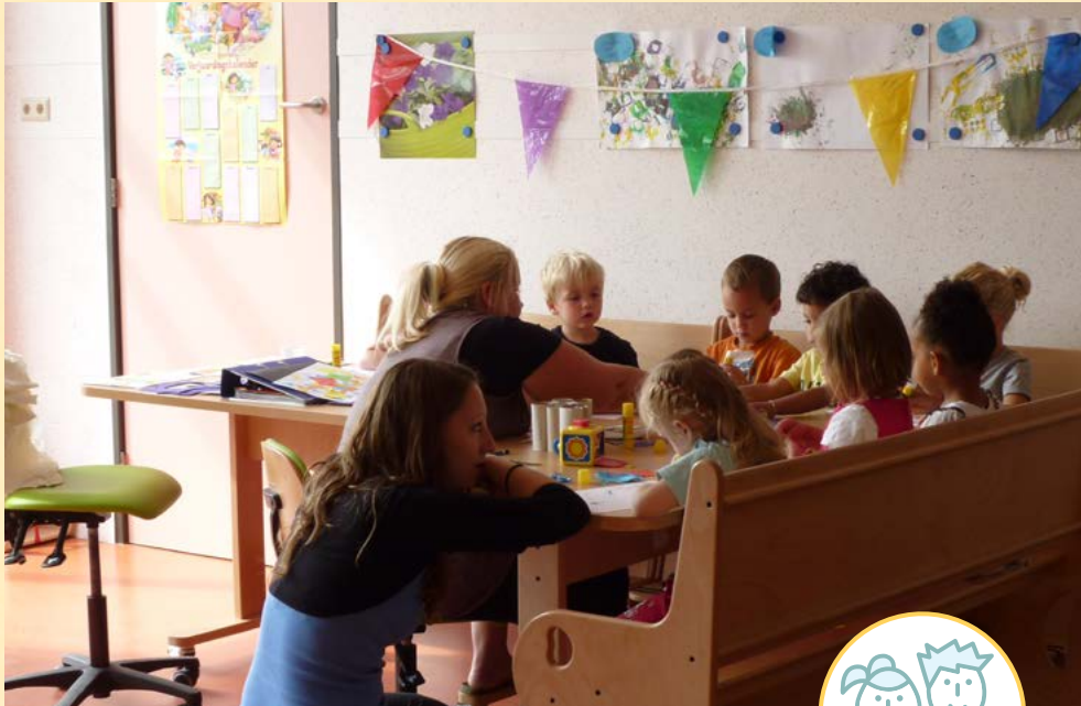
ergens in Nederland